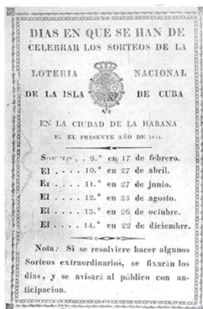
L. de X. Dito en que se han de celebrar los sorteos de la Lotería Nacional de la Isla de Cuba.

La usura había vencido a la moralidad y Carlos III, autotitulado el rey de reformas liberales, mediante Real Cédula del 31 de julio de 1745, legaliza los juegos " ...sin que ellos se puedan exceder de una pequeña y prudente cantidad ". Copia de esta Lotería aparecieron después en América. Era obra del despotismo ilustrado que también ilustró la mente de los virreyes en las colonias de Ultramar. Este hecho hizo que el Virrey Marqués de Croix, en Nueva España, dictase mediante bando la orden de instituir la Lotería. El entusiasmo siguió y fue Martín Gregorio del Villar quien solicitó licencia para establecer en Santiago de Chile la lotería, y que fue aprobada por el Cabildo el 14 de octubre de 1778. Movido por iguales intereses, Ventura Ferrer solicita a la corona el 18 de mayo de 1803, establecer con grandes beneficios la Real Lotería en La Habana.