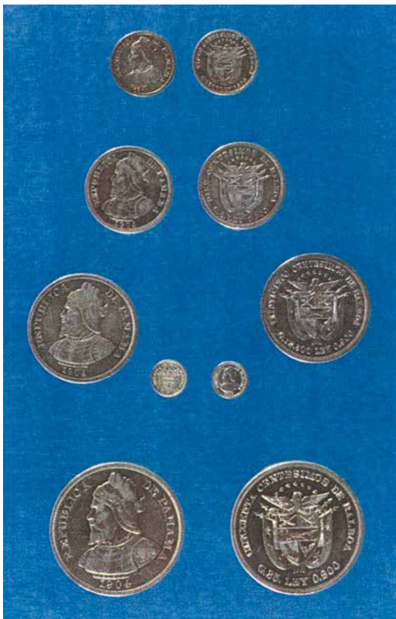
Ley N°. 84 de 28 de junio de 1904:

Acuñaación de Monedas de 0.50 (o Peso) 0.25 (o Cuarto) 0.10 0.05 0.025 (o Medio)