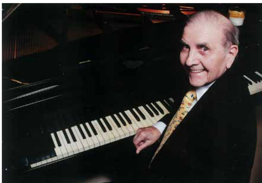
Seda azul, Sin sufrimiento, Dime que sí, Gold is justa dream, las canciones de El Fusilado y de Donde es más brillante el sol, salieron aporreando estas teclas. Sí señor, ese crear con el piano fue la mejor parte de mi vida.»