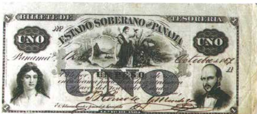
Billetes del Estado Soberano de Panamá, impresos de acuerdo a autorización otorgada al Estado de Panamá en el año de 1865.