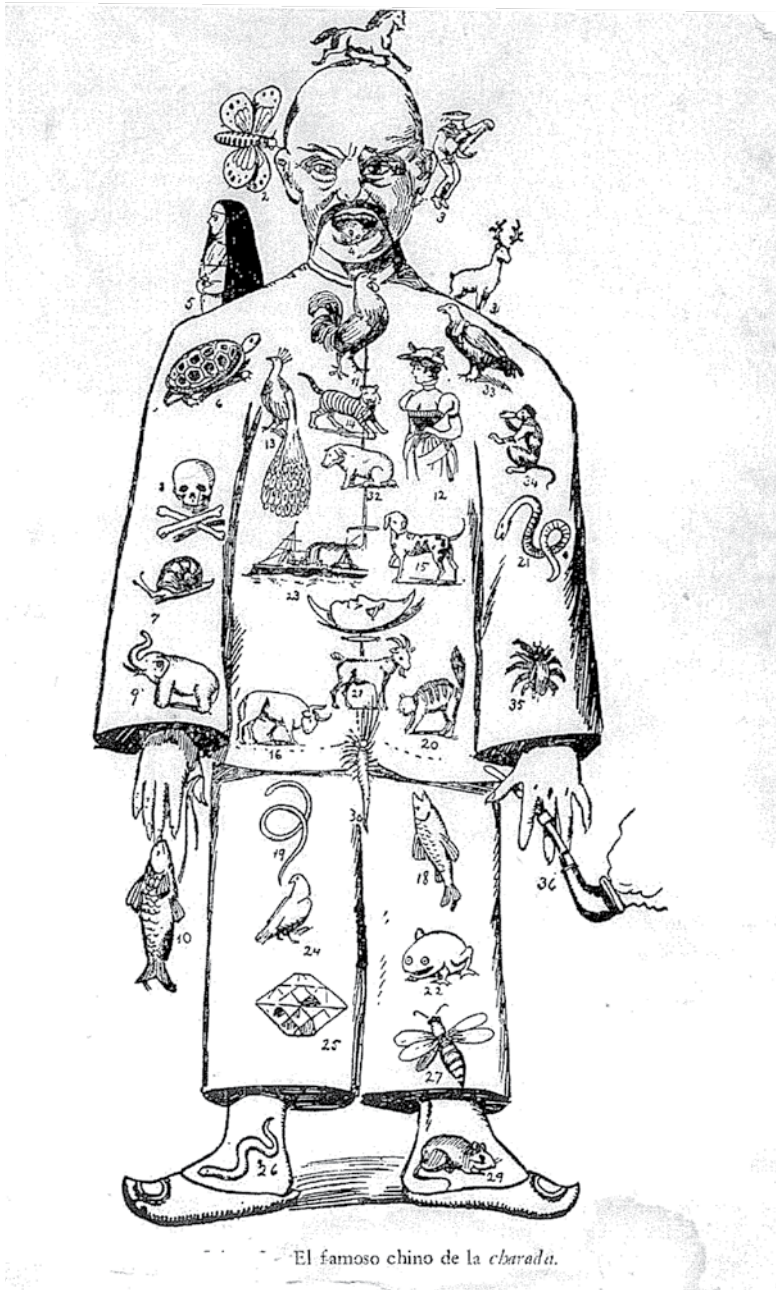
El famoso chino de la charada.