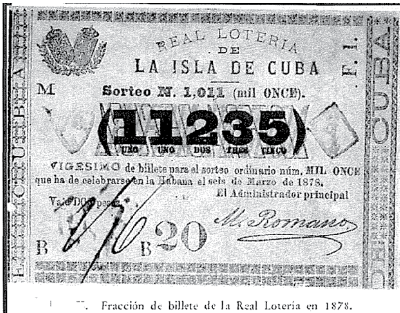
Fracción de billete de la Real Lotería en 1878.