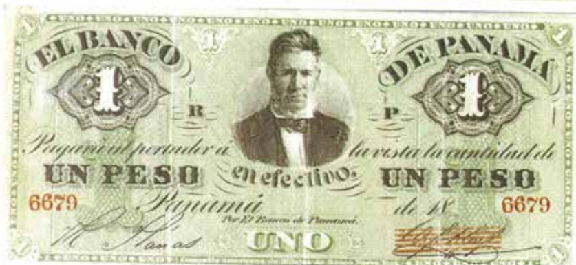
Billetes de Banco particular impresos por el Banco de Panamá, sucesor del Banco de Planas.