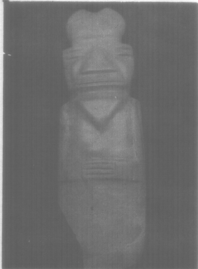
Colgante de jadeíta, labrado en el motivo conocido como "Dios Hacha", motivo de amplia expansión en la zona intermedia de América Nuclear. Colección del Museo Nacional de Panamá. (Procedencia: Costa Rica).

fechas tan tempranas como los siglos VIII y IX d. C., y posiblemente un poco antes. El pendiente de jade encontrado en Cerro Manicular y la pieza fragmentaria de oro hallada en la base de la Estela H. en Copán, así lo sugieren.