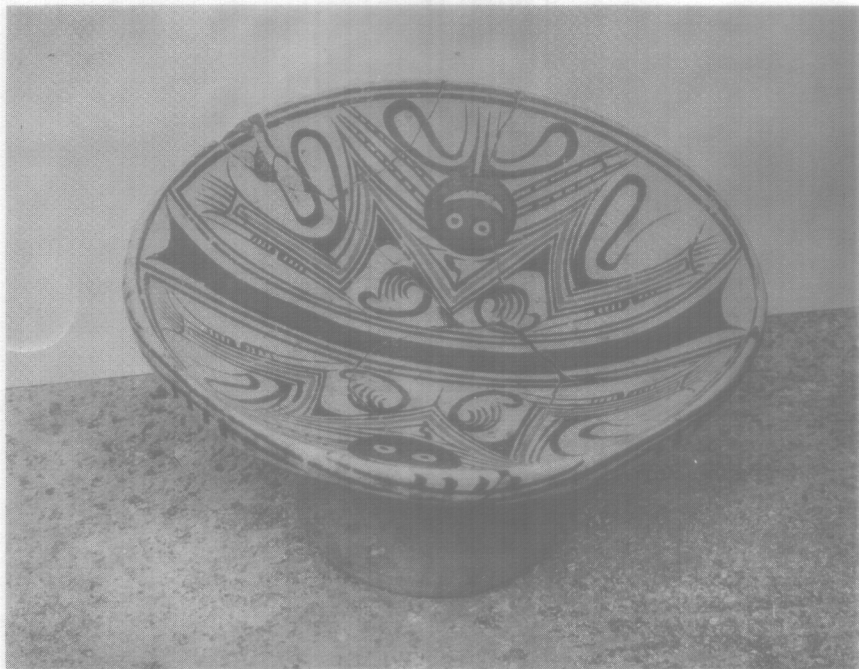
Plato policromo (rojo, negro y blanco) sustentado por un pedestal, encontrado en el sitio El Indio.

El jueves 19 de marzo se inauguró en la Sala de Exhibiciones Especiales del Museo Nacional, la exposición del material arqueológico de la Cultura de Tonosí.