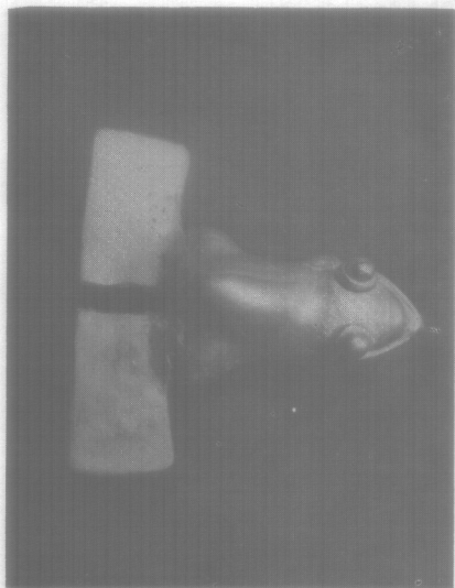
Típica rana con patas en forma de es- pátula, característica de la orfebería pre- colombina panameña. Colección del Mu- seo Nacional.

Es evidente que las fron- teras políticas hoy vigentes a lo largo del istmo centro- americano no rigen en quan- to a lo cultural y no rigieron tampoco a través de la his- toria. Este istmo ha servido desde el momento de su na- cimiento geológico, como paso y puente de las distin- tas culturas del norte, del Sur y del Caribe. Esto ya ha sido señalado muchas veces, y es particularmente rele- vante la observación de un destacado geógrafo: "Quizás en ninguna parte del mundo ha habido un pasaje terre- stre tan angosto, largo y sig- nificativo". (Sauer, 1959: 116).