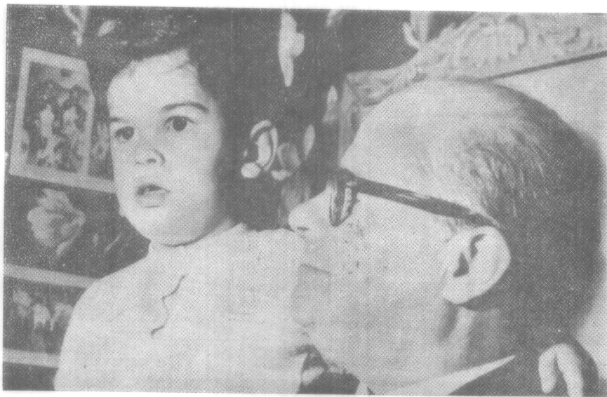
El Dr. Carlos Lleras Restrepo, presidente de Colombia, en compañía de uno de sus nietos.