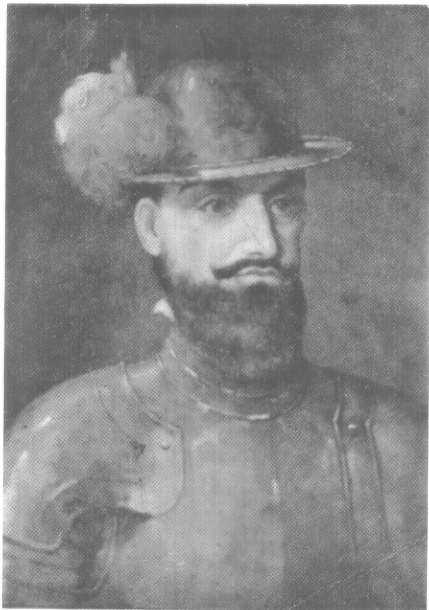
LICENCIADO GASPAR DE ESPINOSA Fundador de La Natá de los Caballeros