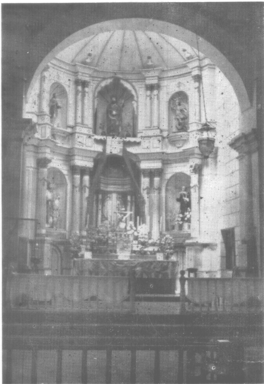
ALTAR MAYOR DE LA IGLESIA DE NATA DE LOS CABALLERROS