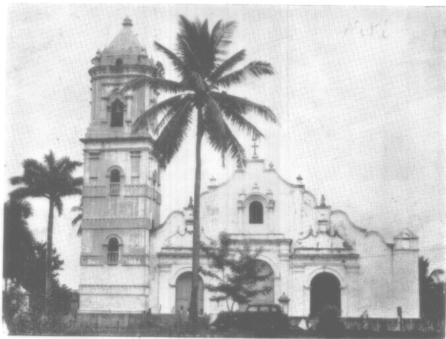
IGLESIA DE NATA DE LOS CABALLEROS