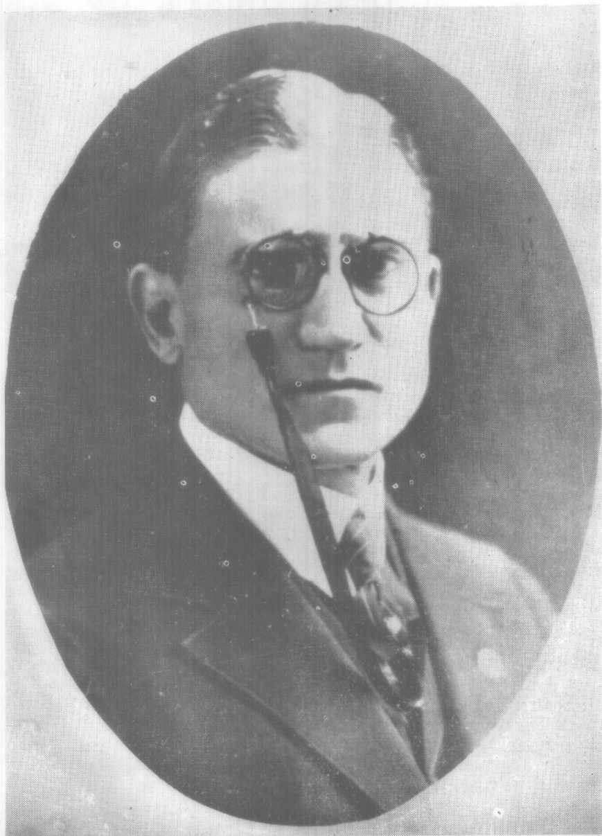
Fotografía del Dr. Eusebio A. Morales, en la época en que ejerció el cargo de Secretario de Hacienda y Tesoro (1922-1924)