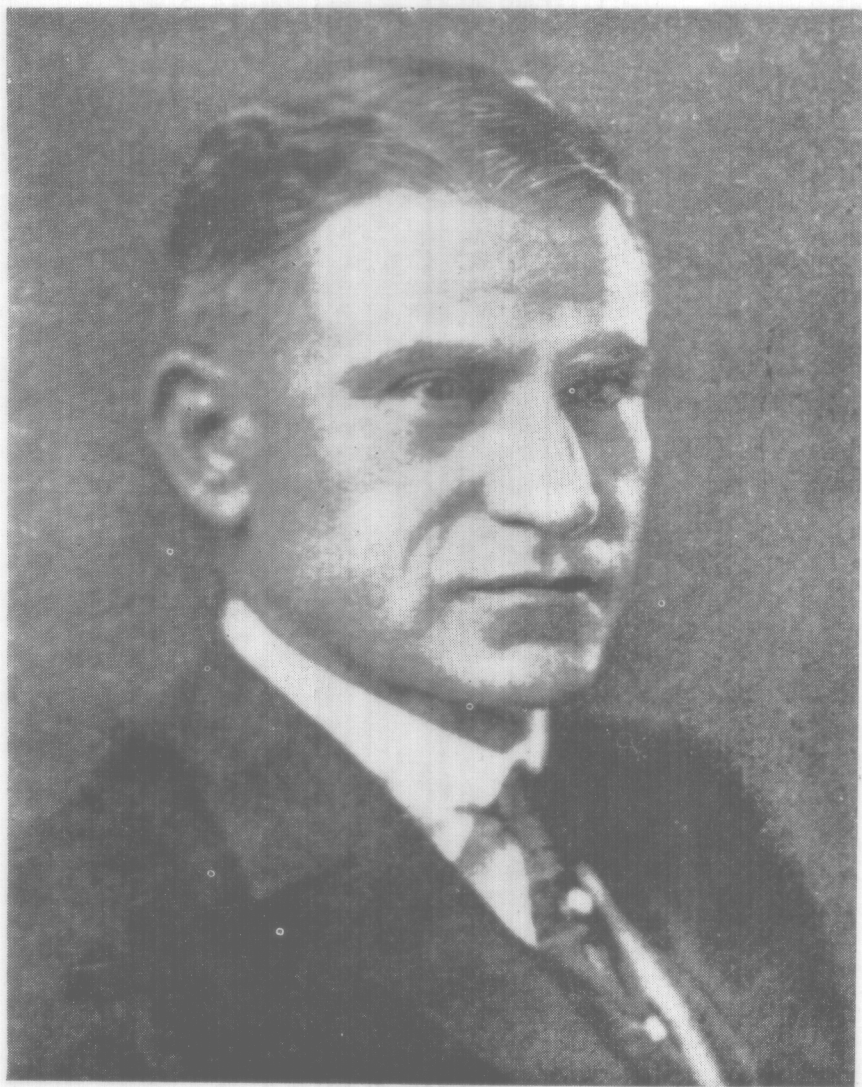
Esta fotografía del Dr. Eusebio A. Morales, sirvió de modelo para hacer el medallón que existe en el Aula Máxima del Instituto Nacional, que él fundó.