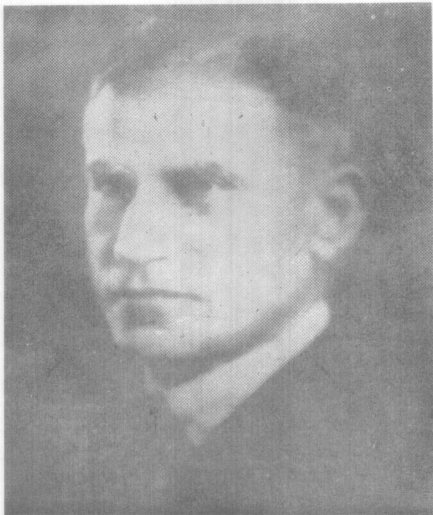
Dr. EUSEBIO A. MORALES