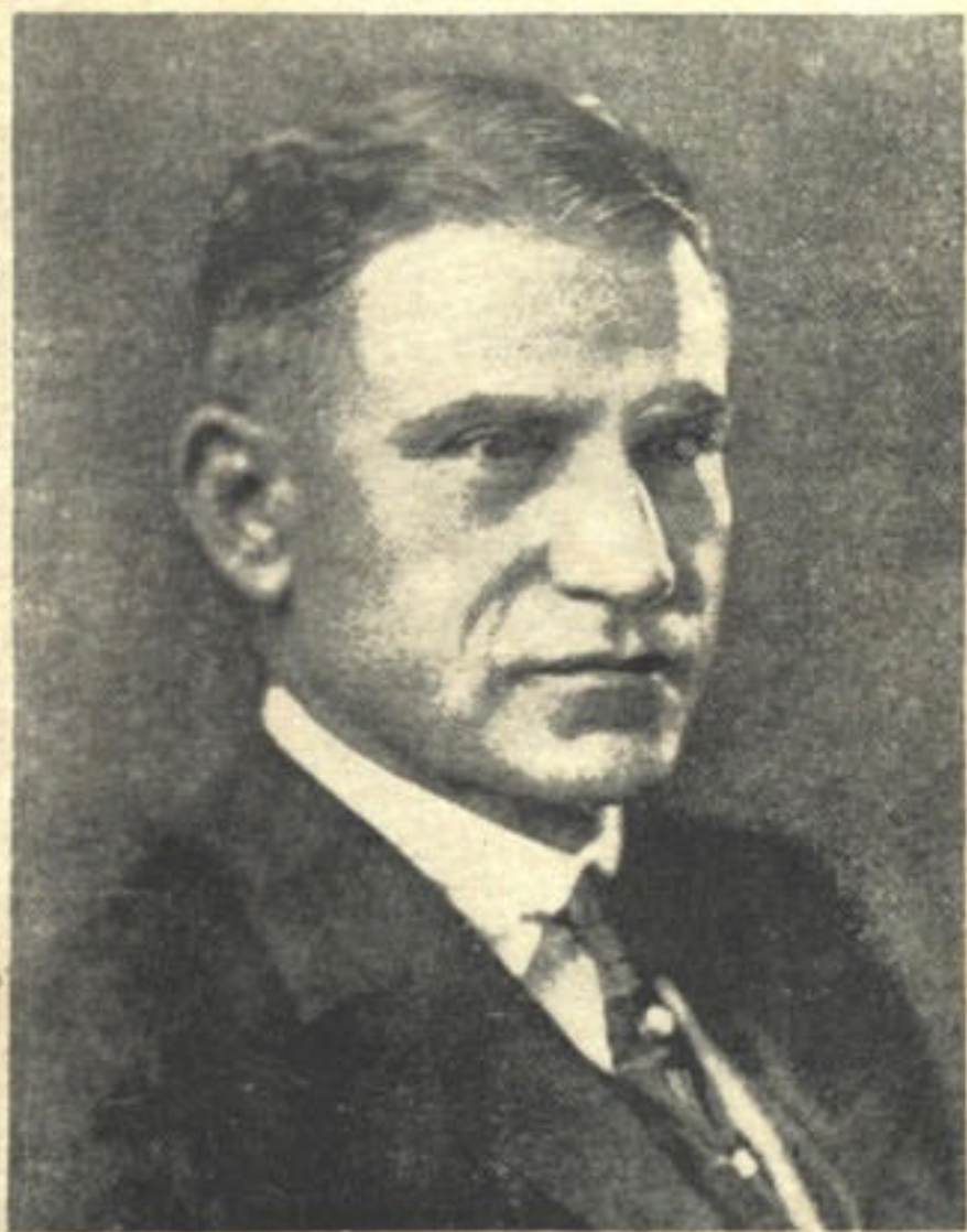
Dr EUSEBIO A. MORALES 1865 - 1929

LOTERIA ORGANO DE LA LOTERIA NACIONAL DE BENEFICENCIA DE PANAMA