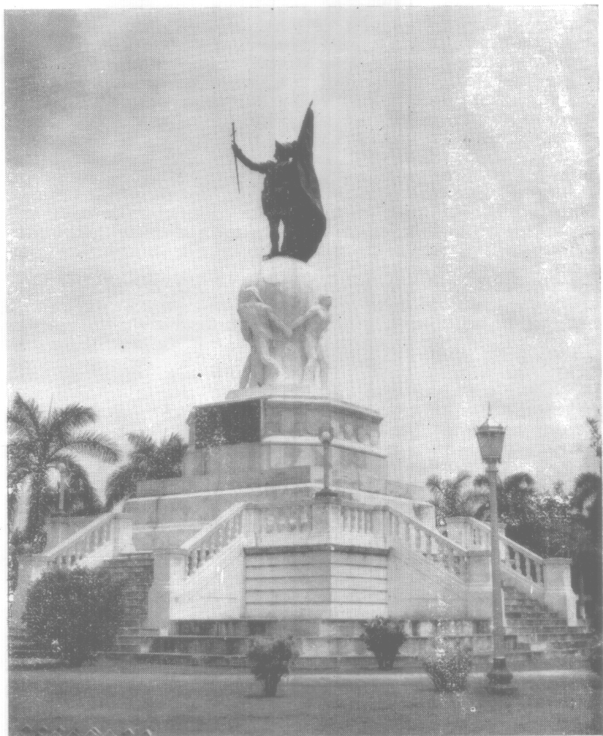
Monumento a Vasco Núñez de Balboa, de los escultores españoles Mariano Benlliure y Miguel Blay, inaugurado por el Presidente de la República, Dr. Belisario Porras, el 29 de septiembre de 1924.