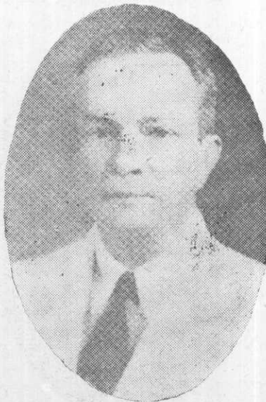
Juan Demóstenes Arosemena