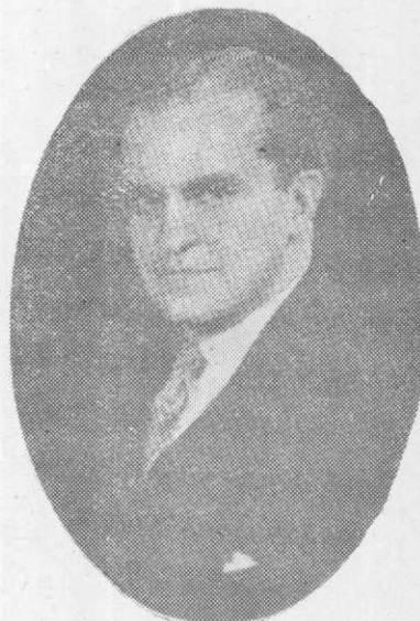
Enrique Adolfo Jiménez