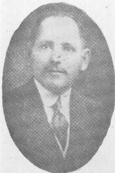
Domingo Díaz Arosemena