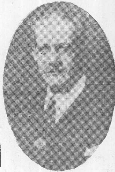
Ricardo J. Alfaro