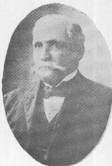
José Domingo de Obaldía