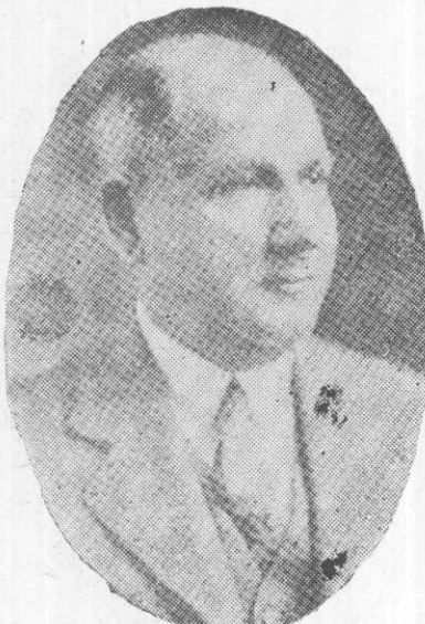
Florencio H. Arosemena