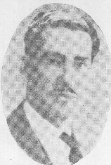
Arnulfo Arias Madrid