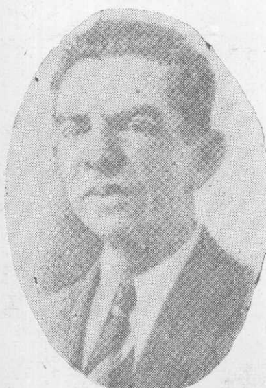
Harmodio Arias Madrid