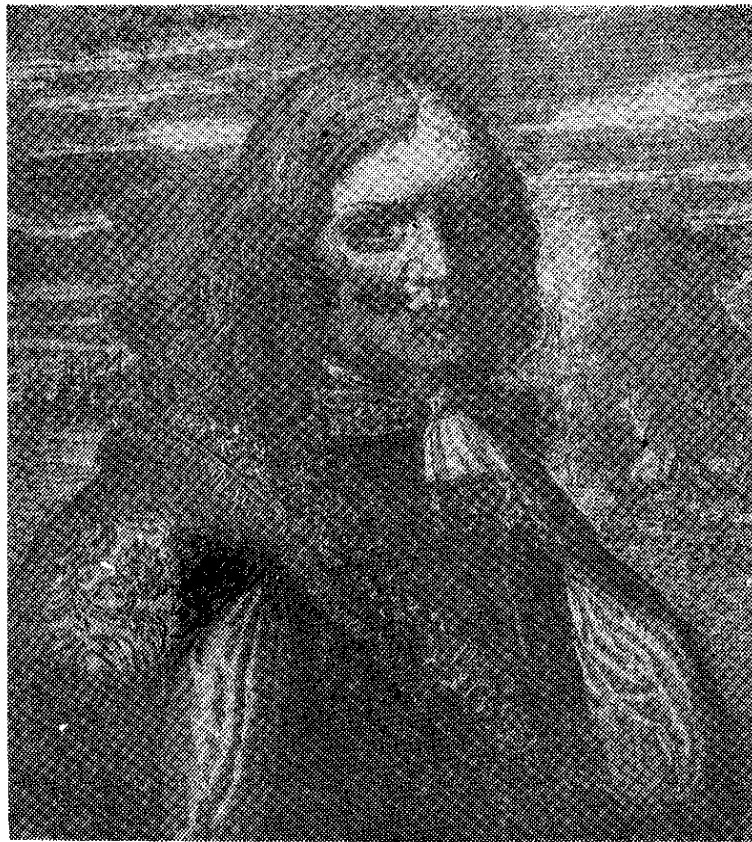
Sir Henry Morgan

El descubrimiento de América de ninguna manera había aprovechado a toda Europa, sino a los españoles exclusivamente, quienes habían dejado que el Papa les regalara todo el nuevo mundo, todo lo descubierto y lo que faltaba por descubrir (a excepción del Brasil). Celosos velaban por el monopolio de posesión y del comercio. Sin embargo, ciudadanos de los demás pueblos de navegantes (ingleses, holandeses, franceses, etc.) intentaron, repetidas veces, por su parte, extraer ganancias del Nuevo Continente. La temible alianza de los FILIBUSTEROS Y BUCANEROS la constituyeron contrabandistas, los cuales no se conformaban con proteger sus naves y mercancías con la fuerza de las armas sino que atacaban las españolas y las confiscaban. Su época de esplendor es la segunda mitad del siglo XVII, en que de la piratería corriente proceden a realizar desembarcos y grandes marchas, tierra adentro, saqueando ciudades y comarcas enteras. Una de esas atrevidas empresas es la expedición de Chagres, en el Océano Atlántico, a Panamá, y la toma de esta ciudad.