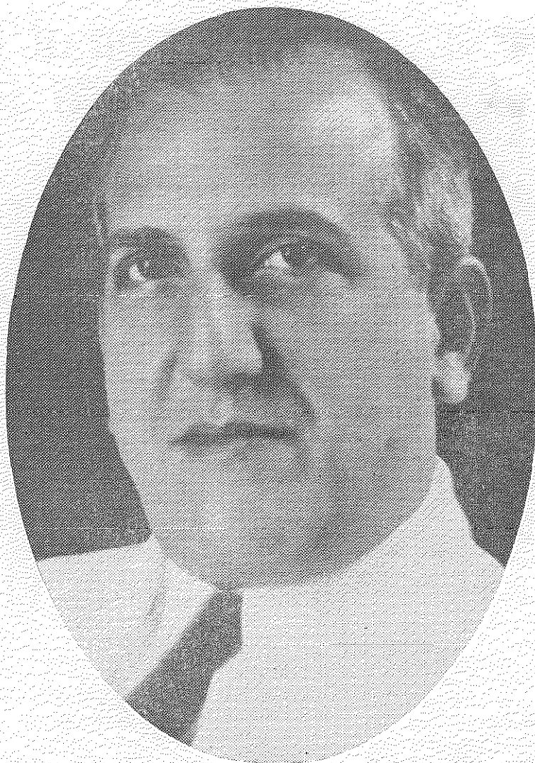
Excmo. Señor don Ricardo Adolfo de la Guardia PRESIDENTE DE LA REPUBLICA

quien, por acto legislativo del 4 de Enero, que dispone la no elección de Designados, continuará ejerciendo el alto cargo de que está investido desde el 9 de Octubre de 1941.