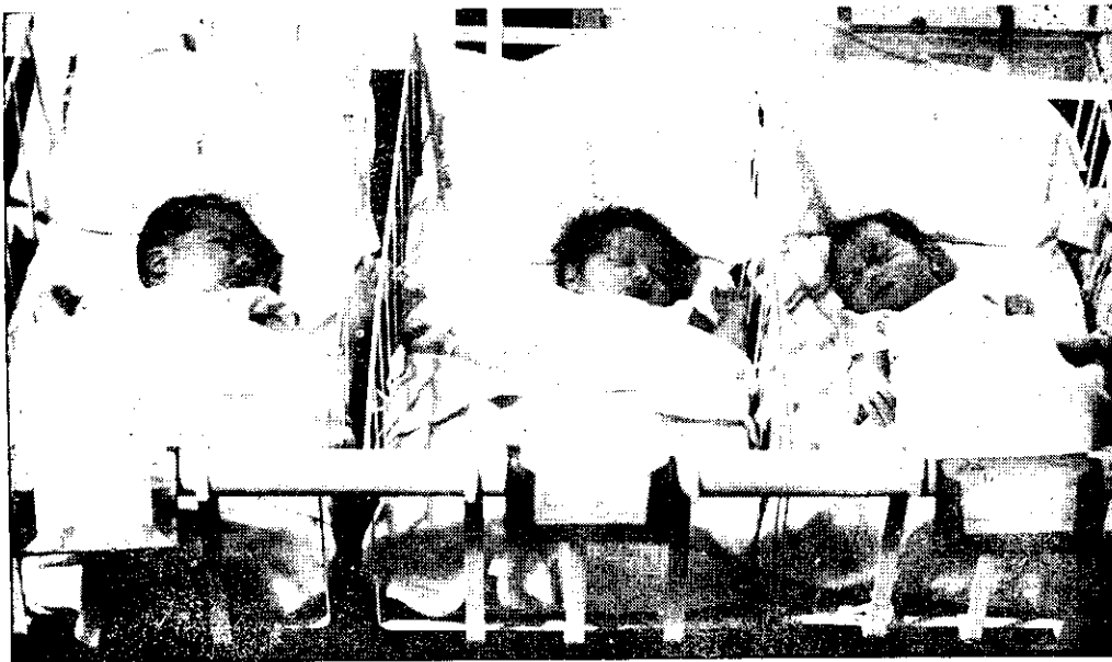
EN UN PABELLON DE MATERNIDAD DEL SANTO TOMAS, INSTITUCION QUE SOSTIENE LA LOTERIA

ASITENCIA SOCIAL, EN SU MAS AMPLIO SENTIDO, ES LA FINALIDAD EXCLUSIVA DE LA LOTERIA NACIONAL DE BENEFICENCIA.