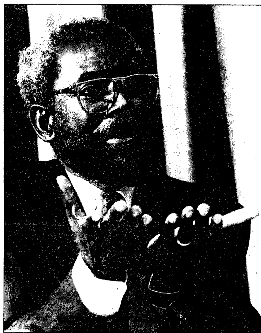
Le chef des démocrates-chrétiens congolais appelle Laurent Kabila à être "le Président de tous les Congolais".