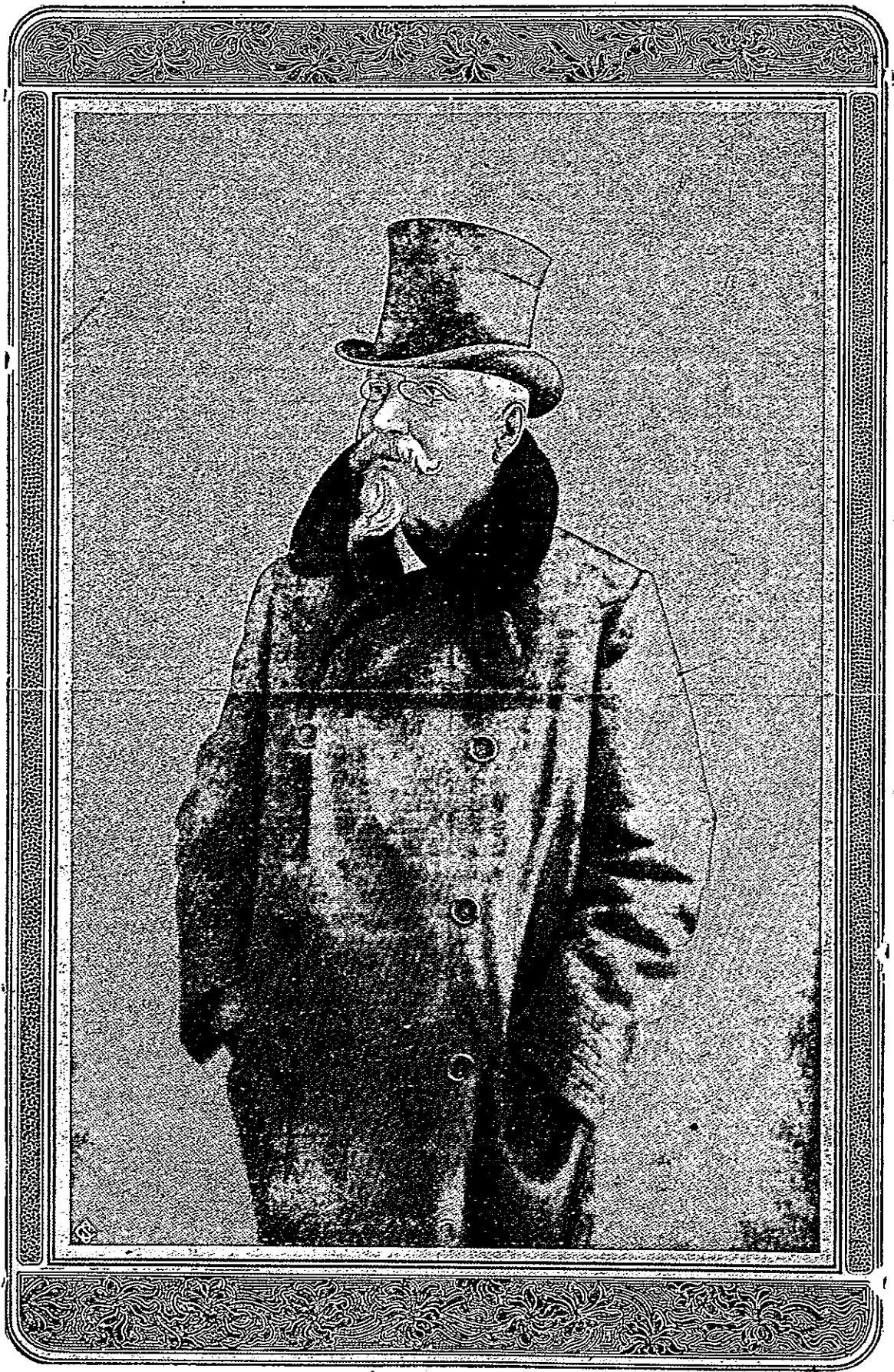
SEÑOR DON JOSE DE ECHEGARAY

Instituido el premio Nobel para premiar periódicamente la energía mental de los artistas de Europa, ha tocado esta vez á dos grandes viejos, (con despecho de los jóvenes) á Mistral , el rey Felibre , al poeta de la Provenza, y á Echegaray , el dramaturgo insigne, el cerebro más extrañamente constituido de cuantos existen y hacen ciencia ó arte. Es incomprendible cómo un hombre tan profundamente versado en las ciencias físicas y mecánicas, cómo un hombre cuyo cerebro debió de estar cuajado de ecuaciones y fórmulas, de complicadísimos cálculos y de intrincadas y contradictorias teorías sobre la acción de todos los agentes naturales, cómo un hombre preocupado con las infinitas nuevas teorías científicas—las cuales debe estudiar concienzudamente, cuando tan clara y galanamente las explica y populariza—pueda al mismo tiempo tener capacidad cerebral para la concepción de obras artísticas é innatas disposiciones para la factura del arte más difícil de la Literatura. ¿Cómo es que la descarnada técnica científica y el seco cálculo, no anonadan en este hombre admirable la imagen poética, la brillante concepción de sus dramas y la ener-