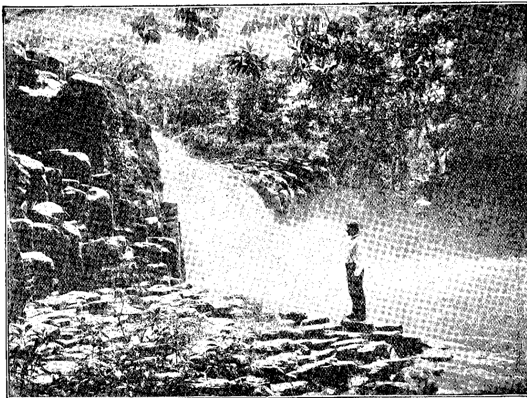
LA CHORRERA.--Vista del salto en el río Caimito.