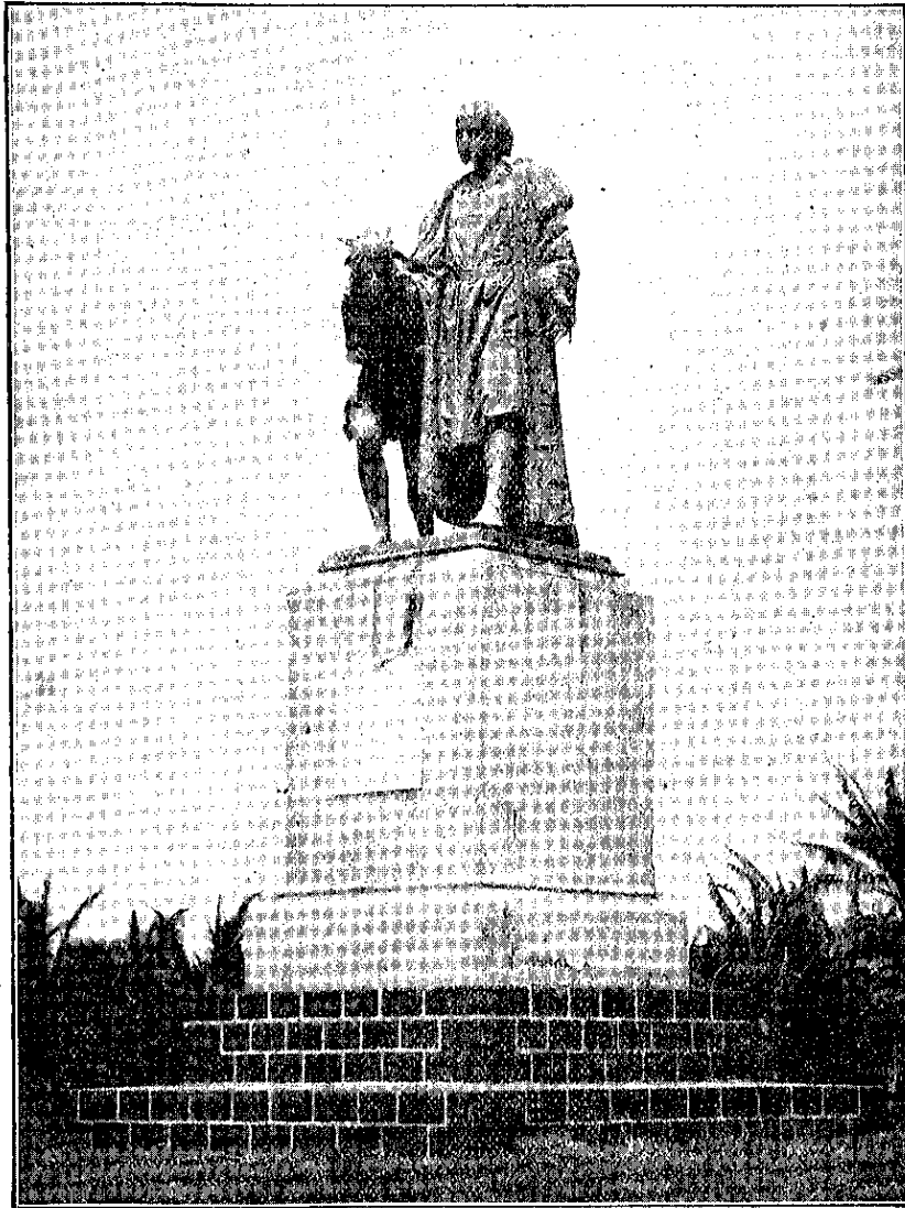
COLON. --Estatua de Cristóbal Colón, regalo de la Emperatriz Eugenia, esposa de Napoleón III.