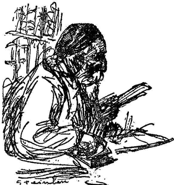
ANATOLE FRANCE La más alta cumbre intelectual de Francia

—Durante sus largos años ha saboreado siempre la vida con refinado goce, este gran ironista de nuestra época: delicadamente, y siempre con aquella oculta pero afable sonrisa que se diría sugerida por alguna broma, medio adivinada, del Hado. Y ahora, cuando ya los años pesan sobre él, todavía contempla la vida con sus claros y certeros ojos, como un viejo