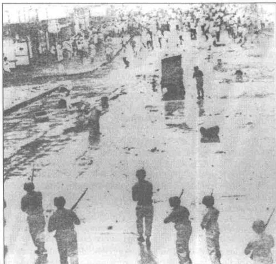
La Guardia Nacional reprime a los estudiantes en mayo de 1958.