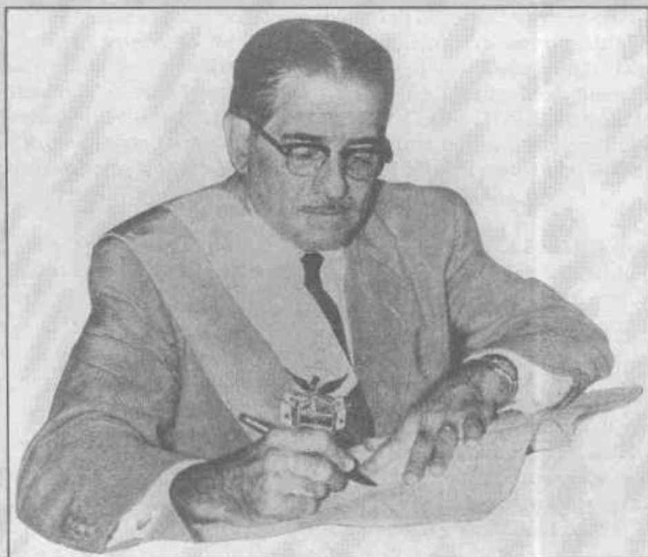
Ernesto De La Guardia Jr. Presidente de la República (1956-1960)