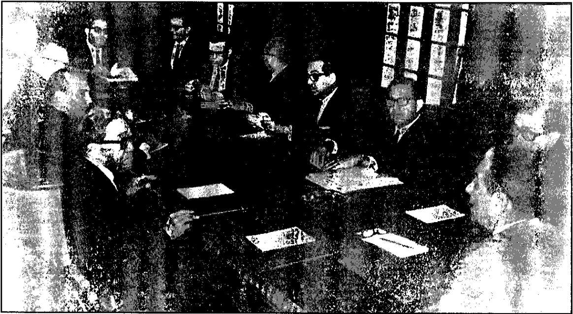
Primera reunión del Consejo de Gabinete de Arnulfo Arias en octubre de 1968.