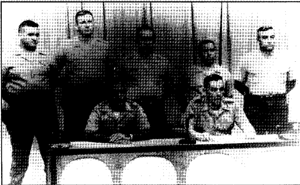
Boris Martínez y Omar Torrijos, gestores del golpe militar de octubre de 1968 y otros miembros del Estado Mayor se dirigen al país en enero de 1969.