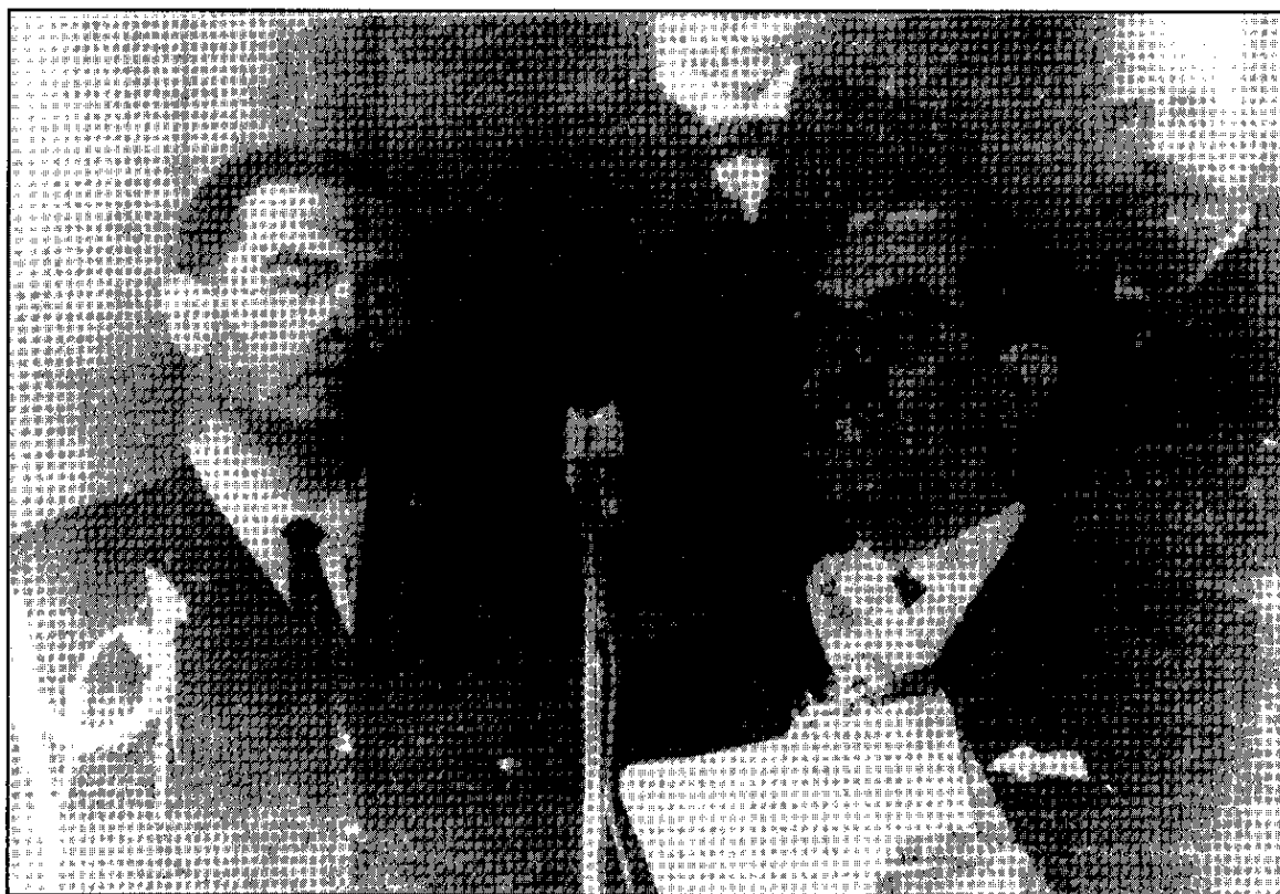
Arnulfo Arias toma posesión de la Presidencia de la República el 1º de octubre de 1968.

de instalación del gobierno, sostuvo que éste sería “del pueblo, por el pueblo y para el pueblo”. Habló de una verdadera Administración Pública que sería ejemplo de eficiencia y que reafirmaría “el concepto de Unión Nacional para beneficio de todos los panameños”. Se refirió, asimismo, a “un futuro de progreso y de confianza en los tiempos que se avecinan” y el final de los “gobiernos invisibles” difícil de discernir y “de los cuales nadie estaba seguro de cómo surgieron, ni qué autoridad tenían, ni qué principios los fundamentaban, ni cuál era su rumbo, ni cuáles sus propósitos reales o aparentes”. Evocó la autoridad moral para resolver los problemas internacionales, del retorno del panameñismo al gobierno con la Unión Nacional y su permanente vigencia. Acotó que: “Todos nuestros mejores esfuerzos se encaminarán a lograr nuestra ya consagrada meta de UN PANAMÁ MEJOR”.