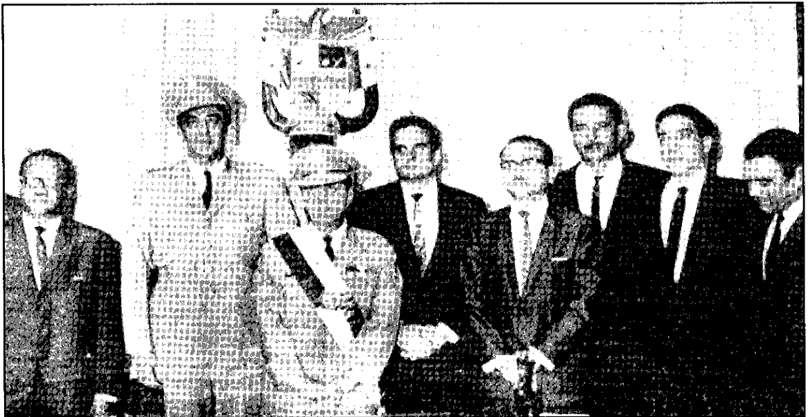
La Junta Provisional de Gobierno y su primer Gabinete.

Acto seguido, la Junta de Gobierno adoptó una serie de medidas destinadas a la obtención del respaldo popular al movimiento golpista. Así, se prohibió el alza de los precios de los artículos de primera necesidad hasta el 31 de enero de 1969, se eliminó el llamado "decreto mordaza" que imponía restricciones a los alumnos para ser dirigentes en las asociaciones federadas. Igualmente, fueron congelados los alquileres de las viviendas de menos de ochenta balboas mensuales y se anunció que un total de cien mil balboas del presupuesto de la Asamblea Nacional había sido transferido a la Universidad de Panamá. Del mismo modo, se eliminó la fianza de excarcelación por el delito de peculado que pasara de los mil balboas y se autorizó al Ministro de Hacienda y Tesoro para que se recuperaran los bienes mediante jurisdicción coactiva. También se autorizó al Instituto de Vivienda y Urbanismo a fin de que procediera a legalizar la permanencia de las familias que habitaban en las barriadas de emergencia de Puente del Rey, Villa del Rey y San Cristóbal. Se acordó, además, establecer la prohibición de aumentar el precio de las medicinas