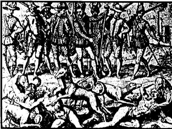
Matanza de indígenas en el Siglo XVI.

sido en muerte de cristianos". Debían ser reducidos a un lugar donde pudiesen servir; los encomenderos debían en este caso tener tres partes de los indios tomados y los compañeros sólo una, a fin de impedir una disipación más profunda de las comunidades indígenas. "Los caciques, su familia y sirvientes quedarían libres. El párrafo es interesante porque nos da noticia de este efecto a retaguardia del descubrimiento de Pizarro. Las empresas de recogedores de indios aparecen a veces registradas en la documentación de Contaduría, cuando los compañeros se ajustaban por una parte del botín. Pero los casos que acabamos de mencionar, ocurridos bajo Pedro de los Ríos, ya no alcanzan, por su fecha, a figurar en las cuentas que se han conservado. Parece ser que aquel Gobernador practicó de una manera más intensa que Pedrarias tales declaraciones de esclavitud de indios ya encomendados, y por eso se le hace cargo en la Residencia. Así las empresas de recogedores de indios, de pacificación y de rescate muestran en acción aun mismo elemento humano, la soldadesca pobre que vive de unos cuantos esclavos o de una soldada ajustada con los encomenderos. Son empresas que significan una prosecución de la conquista en pequeña escala, minando parcialmente los cuadros de la encomienda y de la explotación regular de los indios.