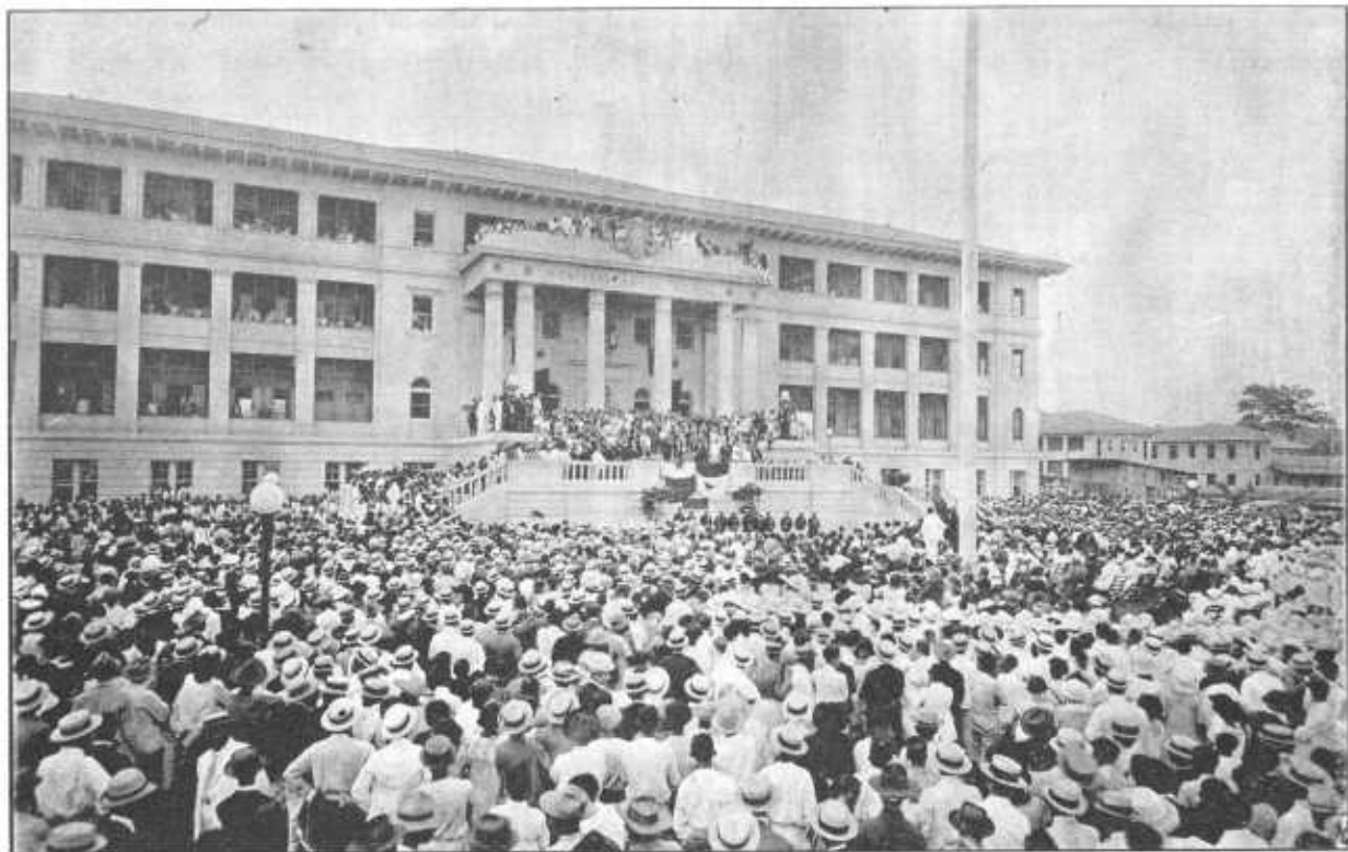
HOSPITAL DE PANAMA EN EL DIA DE SU INAUGURACION. (Ciudad de Panamá.)