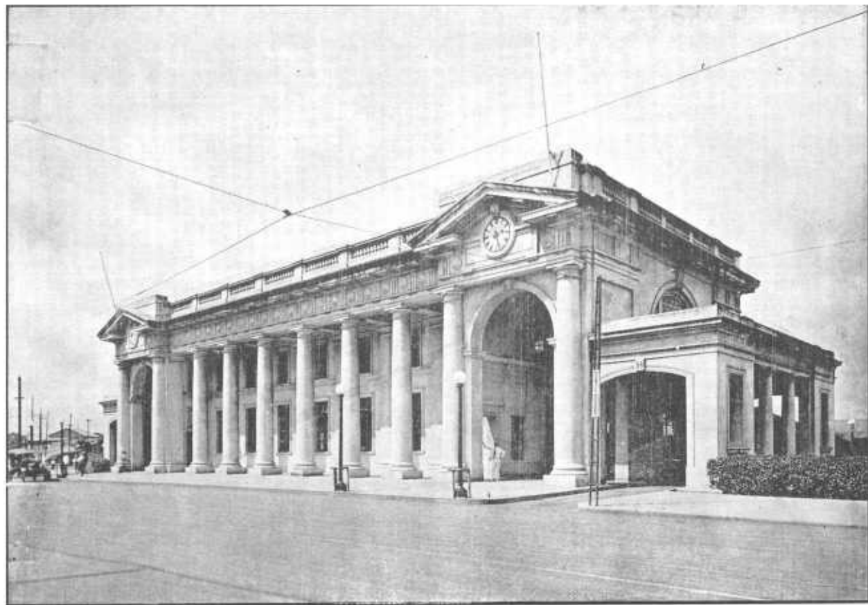
ESTACION TERMINAL DEL FERROCARRIL DE PANAMA—(Ciudad de Panamá)