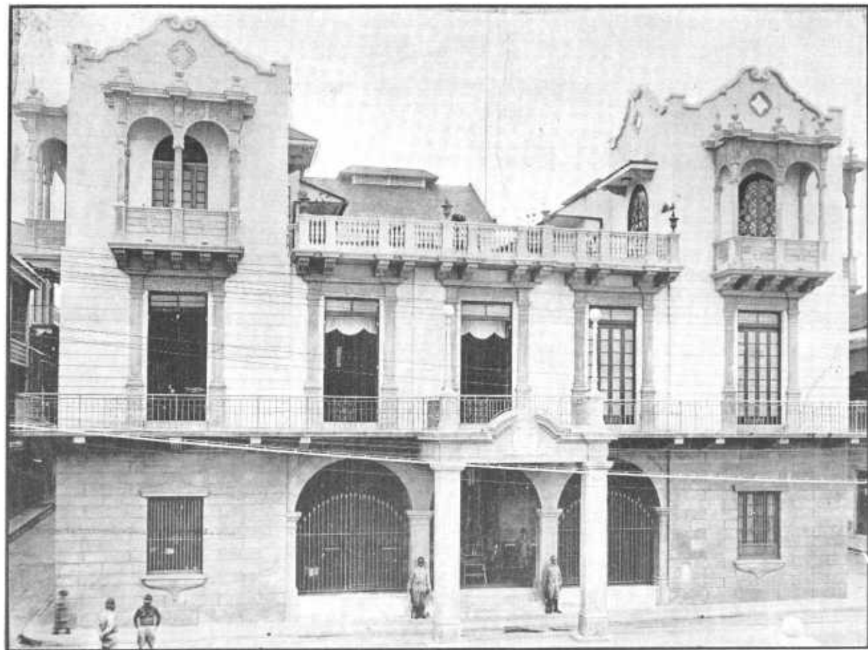
CASA PRESIDENCIAL—Vista de la fachada(Ciudad de Panamá)