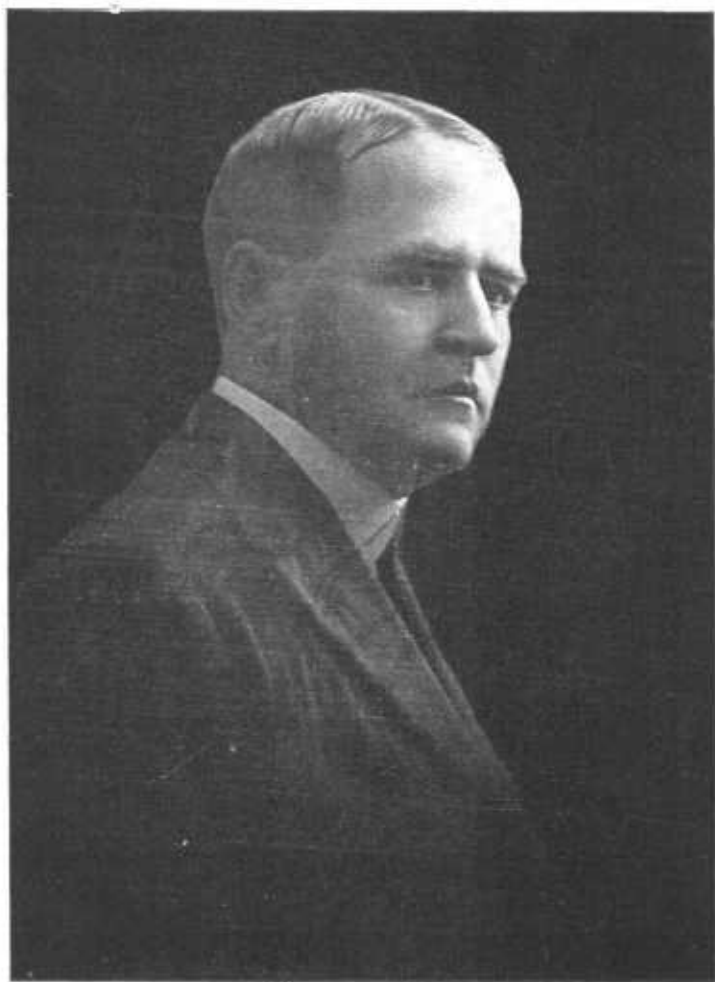
EXCMO. SEÑOR DON RODOLFO CHIARI Presidente de la República (1924-1928)