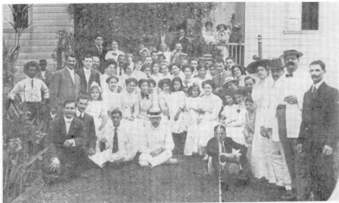
De las tres corrientes de migración judía a Panamá la más antigua es la Sefadí, que data de la época del oro de California y la construcción del Ferrocarril Interoceánico. Los Sefardíes vinieron de Curazao, Jamaica y Saint Thomas. Paseo campestre de la comunidad judía Kol Shearith a la casa de veraneo del primer presidente de Panamá, Manuel A. Guerrero, en Las Sabanas (cerca 1904).