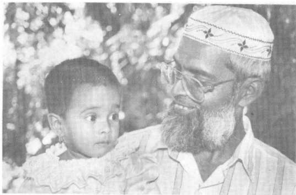
El 95% de los hindostanes se han radicado en la Ciudad de Panamá dedicándose al comercio. Su estilo de vida cambió después de establecerse aquí y se observan cambios en su alimentación y lenguaje. Padre hindú en la provincia de Cocle con su hija.