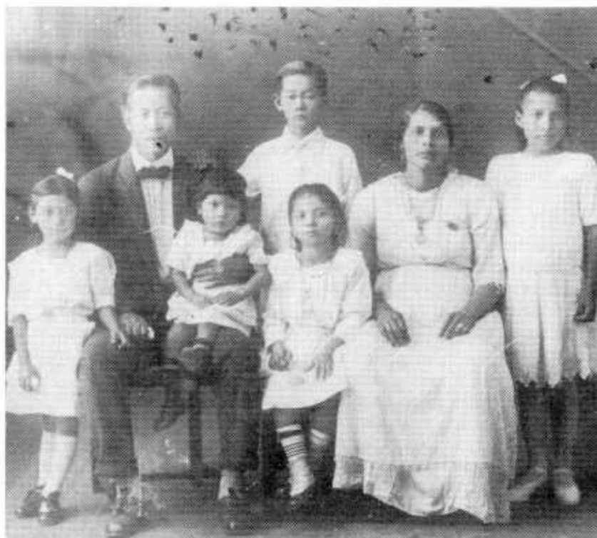
Grupo familiar mixto. En la foto observamos a un inmigrante chino casado con una panameña y sus hijas. A la derecha del padre observamos a su hijo chino del matrimonio anterior (circa 1920).