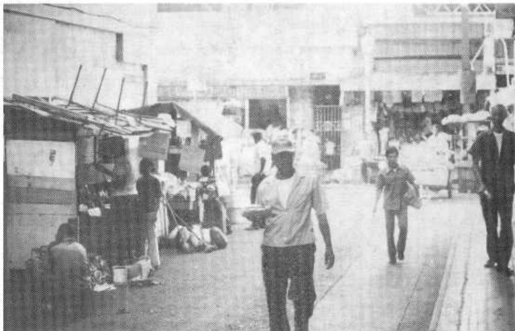
Los inmigrantes chinos destinados a trabajar como jornaleros de las obras de la comunicación interoceánica terminaron desplazándose hacia el comercio, los servicios o la agricultura. Escena callejera del viejo barrio chino de Salsipuedes en ciudad de Panamá, 1972.