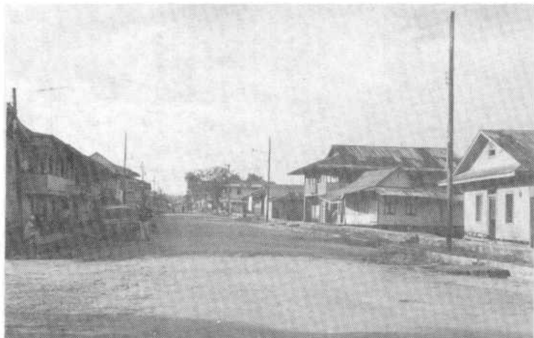
La población de la provincia de Bocas del Toro se compone de negros criollos o creoles, indígenas Guaymies, Tóribes y Bribri y de campesinos "latinos" o mestizos. Escena de la calle principal de la ciudad de Bocas del Toro, isla Colón.