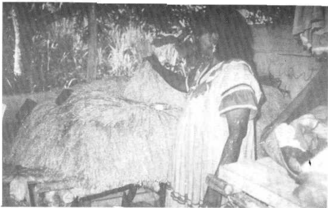
Los guaymíes o ngobes son el grupo indígena más numeroso de Panamá. Sus comarcas ocupan partes de las provincias de Chiriquí y Veraguas, en el Pacífico, y Bocas del Toro en el Caribe. Mujer guaymí con arroz recién cosechado.