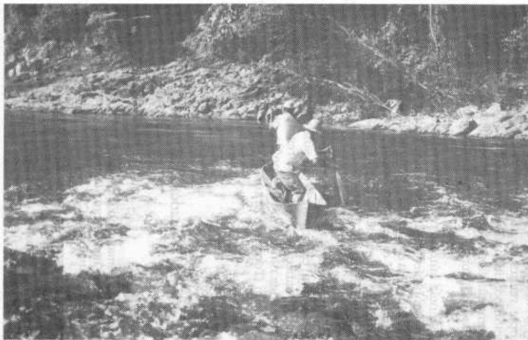
Los Bokotá son el grupo indígena más pequeño de Panamá y viven en la Vertiente Atlántica, en la cuenca del Río Calovébora y sus afluentes, entre las Provincias de Veraguas y Bocas del Toro. Vista tomada en 1970, Río Calobébora.