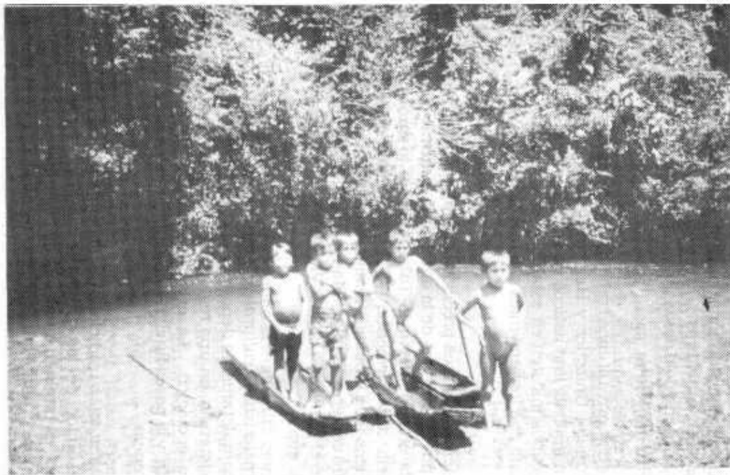
Los indígenas kuna se encuentran ubicados en los Ríos Tuira y Chucunaque en Darién, en el Río Bayano de la Provincia de Panamá y en las islas y costas de San Blas en el Atlántico. Niños kuna del caserío de Icandí o Aguas Claras, afluente del Río Bayano, en 1970 antes de iniciarse los trabajos de la hidroeléctrica.