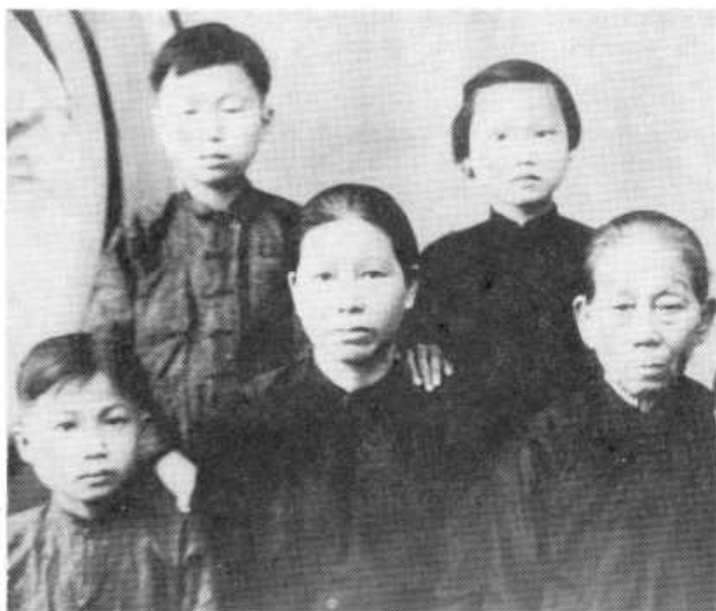
Después de la población negra de Las Antillas, la mayor inmigración hacia Panamá ha sido la de los Chinos. La primera oleada vino cuando el oro de California a la construcción del Ferrocarril Interoceánico. Luego vendrían a las obras del Canal Francés y el Norteamericano. El primer contingente llegó en 1852. Familia de inmigrantes chinos (c. 1920).