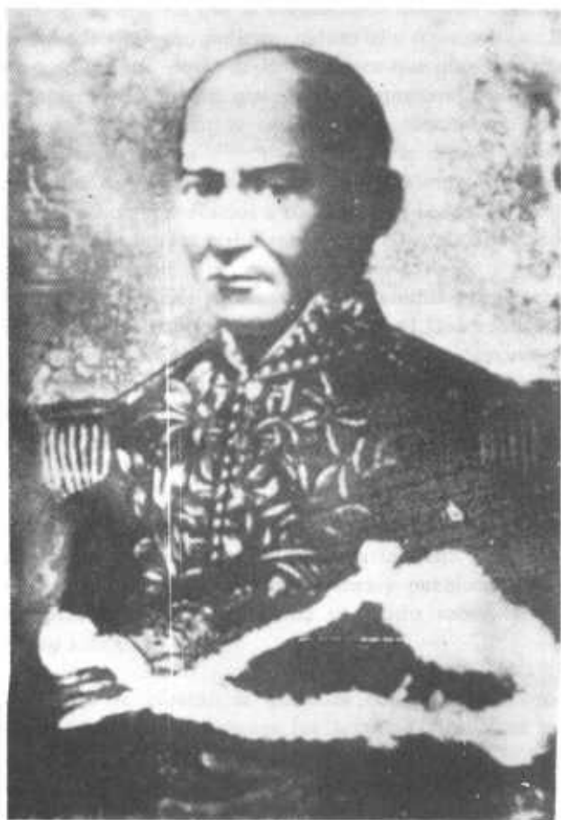
General JOSE DOMINGO ESPINAR

Médico, ingeniero y militar, natural de la ciudad de Panamá y Prócer de la Independencia Americana.