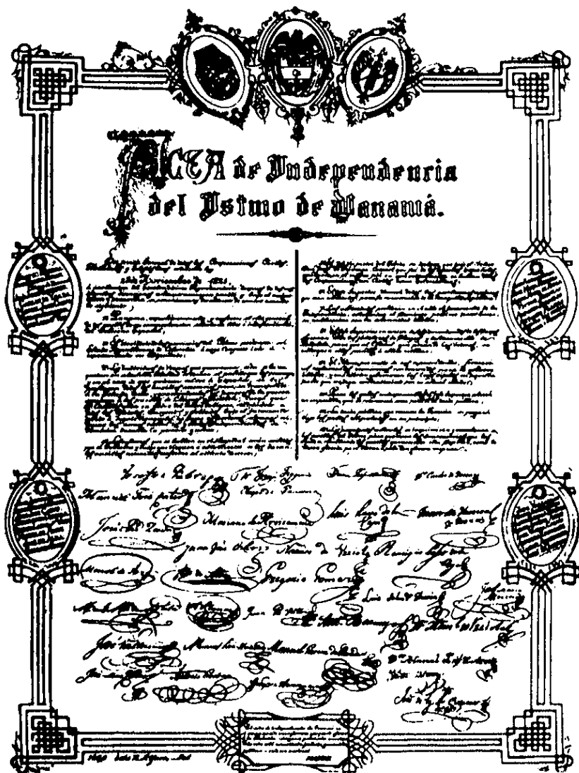
Facsímil del Acta de Independencia de Panamá de España.

Documento que el Libertador calificó como "el más glorioso que pueda ofrecer a la Historia ninguna Provincia americana"