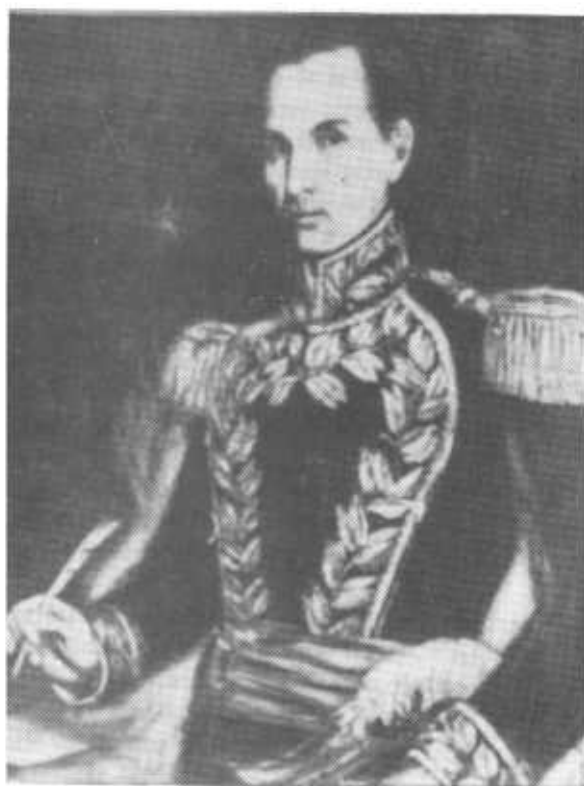
General JOSE DE FABREGA

Prócer Auténtico del Movimiento Separatista de España en 1821.