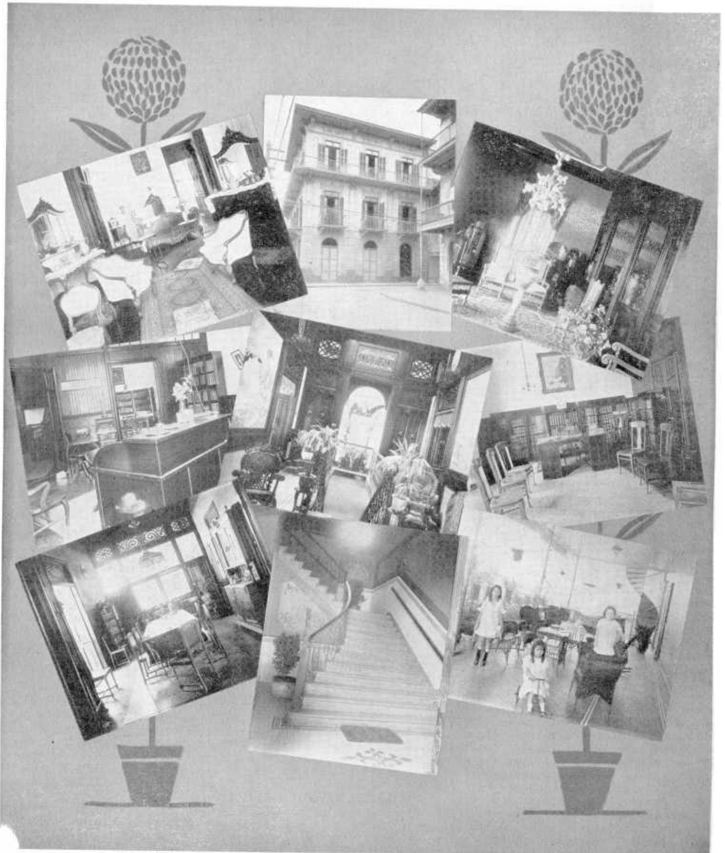
Dormitorio, Oficina, Comedor.