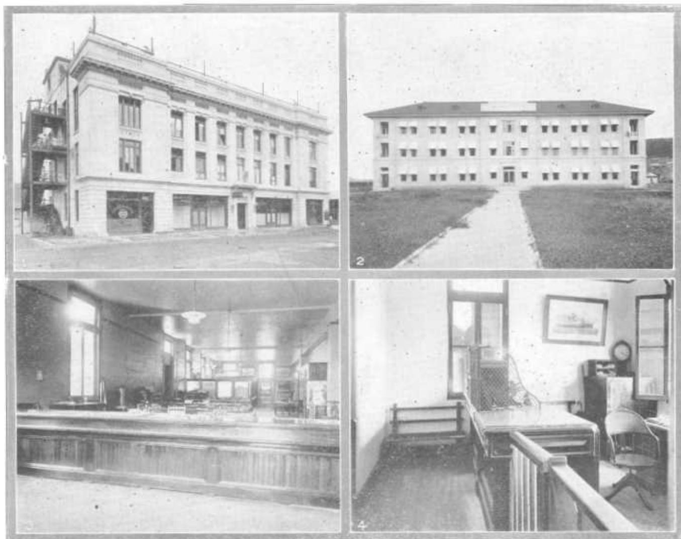
1 y 3. Exterior y Interior, Oficina en Cristobal 1 and 3. Exterior and Interior, Cristobal Office