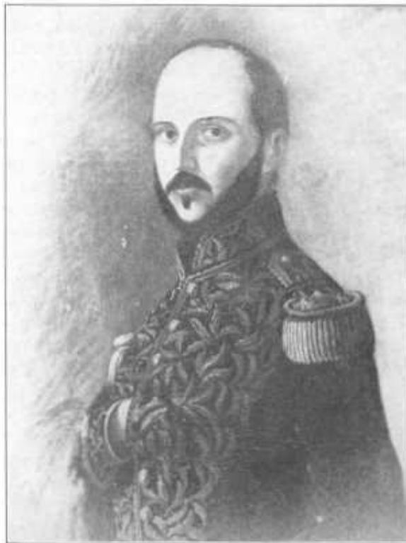
General José de Fábrega

When New Granada was organized following the dissolution of Greater Colombia in 1831, the Isthmus continued dependent on the Central government at whose head General