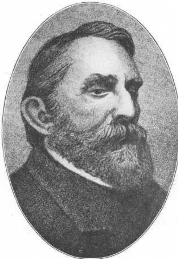
Doctor Rafael Núñez

Doctor Rafael Núñez, the victor of the revolution of 1885 on taking over the executive power, declared the constitution of 1863 annulled, at the same time calling together a