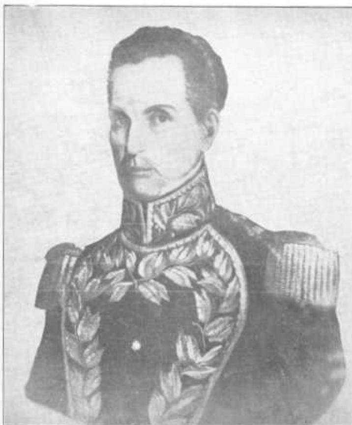
General Tomás Herrera

One of the consequences of the migratory movement was the arrival of cholera. This disease ravaged the Isthmus under the government of Manuel Maria Diaz. The railroad work was commenced under the direction of William Aspinwall, with whom were associated John Lloyd Stephens and Henry Chauncey. The first railroad company obtained its concession by a contract with the government of New Granada signed on April 15th, 1850, the first idea being to construct the road from the bay of Porto Bello on the Atlantic side but owing to enormous demands which were made by the land owners for their rights there, it was decided to make