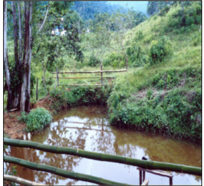
Figuras 67: Los estanques se localizan en las propiedades de los asociados (foto superior), quienes se responsabilizan del cuidado de los peces a los que alimentan con los frutos de algunas palmeras y con nidos de termitas, conocidos como “comején” (foto inferior).

propuestas donde manifiestan sus intereses.