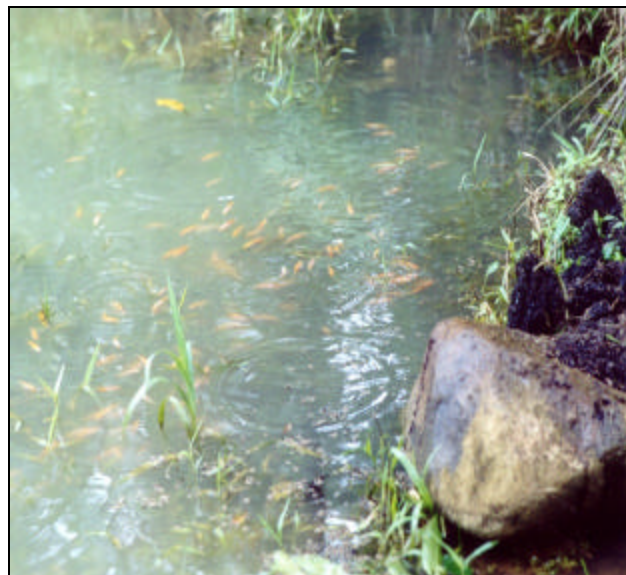
Figura 5. La cría de peces suplirá las proteínas necesarias para mejorar los niveles nutricionales de los moradores de la región, lo que redundará en el incremento de su capacidad productiva.

También es importante la contribución a la conservación del ecosistema, debido a que la comunidad se ubica dentro del Bosque Protector Palo Seco, que limita con el Parque Internacional La Amistad (PILA). Con la ejecución del proyecto y las actividades que de él se desprenden, se contribuye con la conservación de la fauna y flora de esa región.