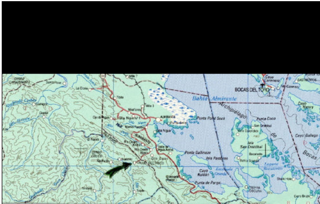
Figura 4. La comunidad del Valle del Riscó se ubica en el distrito de Changuinola, provincia de Bocas del Toro.

Escala: 1:250,000