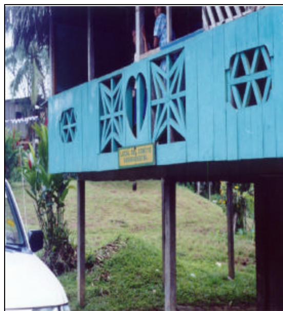
Figura 1. ASAFRI cuenta con un local para coordinar la ejecución de las acciones derivadas de los proyectos que lleva a cabo.

El proyecto tuvo una duración de un año, en el que se cumplieron los objetivos previstos. Sin embargo, no fue sustentable, debido a que las actividades no continuaron más allá del periodo de ejecución.