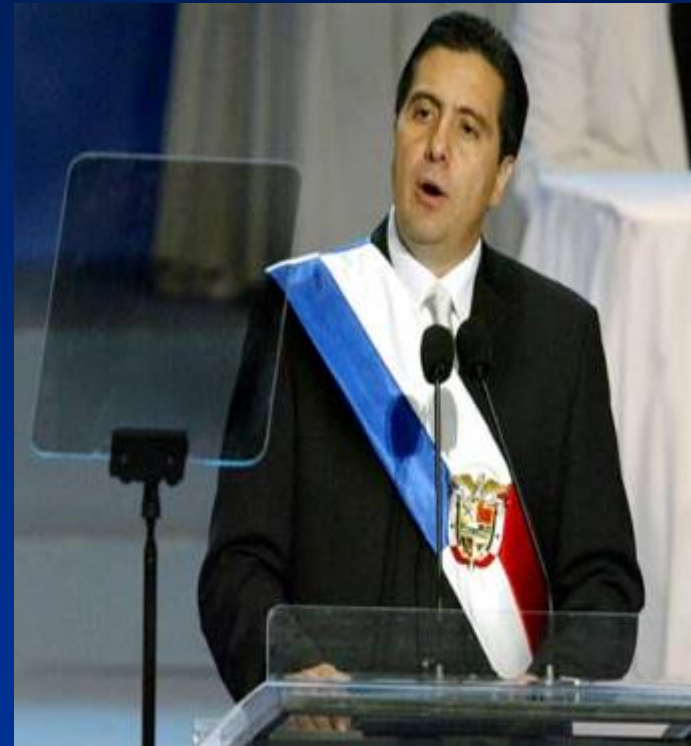
Martín Torrijos 2004-2009

El Órgano Ejecutivo está constituido por el Presidente de la República y los Ministros de Estado. El Presidente de la República será elegido por sufragio popular directo y por la mayoría de votos, para un período de cinco años y no consagra la reelección del mismo.