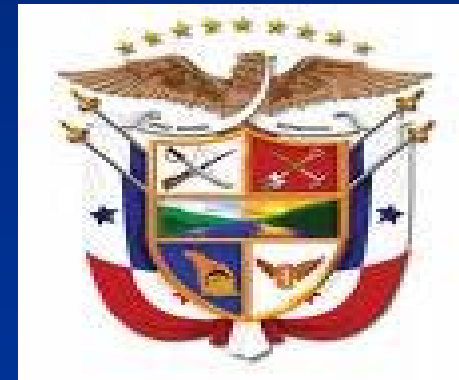
Escudo de Armas