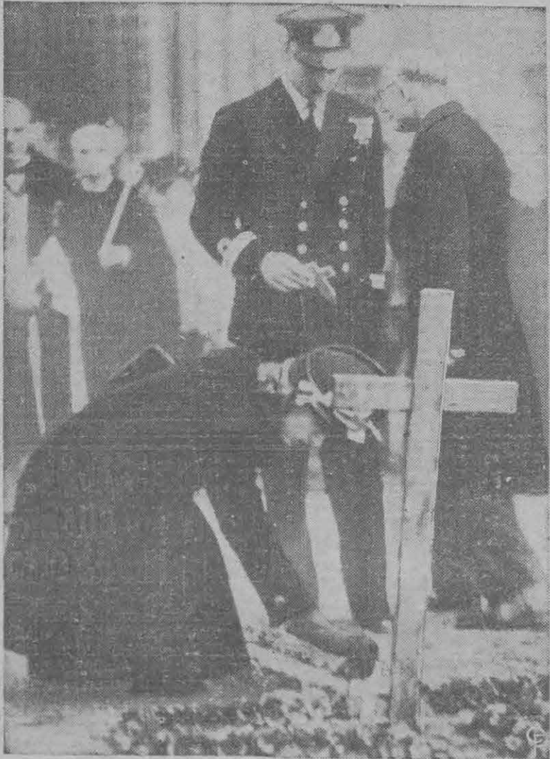
Mientras su novio, el Teniente Felipe Mountbatten, observa, la Princesa Real coloca una cruz en el sitio destinado a recordar a los muertos en defensa de la patria. La primera pareja de novios del mundo distrajo unos minutos del tiempo que tienen destinado a sus arreglos pre-nupciales, para cumplir con este deber.