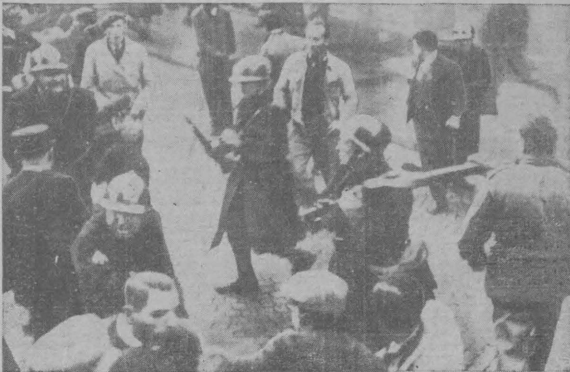
Los Guardias móviles franceses han tenido mucho trabajo durante los últimos días en París. Aquí los vemos tratando de dispersar a una muchedumbre de 15.000 huelguistas y simpatizadores frente al Palacio Municipal de la capital francesa, durante una manifestación de la Unión de Trabajadores Sanitarios, controlada por los comunistas.