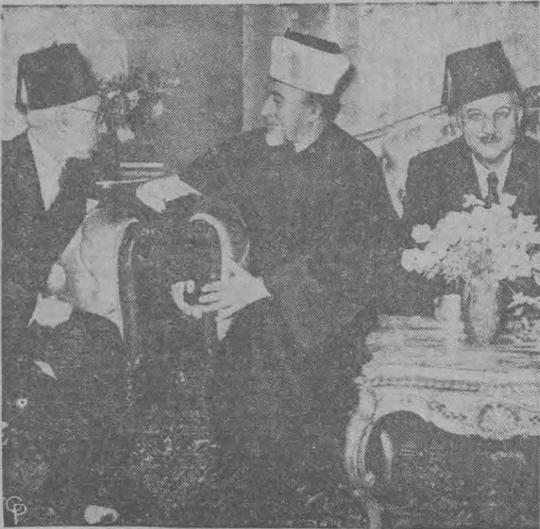
Tres líderes de la Liga Arabe se reunieron hace poco en Aleya, Libano, para recomendar "precauciones militares" en caso de que los británicos evacuaran a Palestina. Su medida inició un inmediato movimiento de tropas árabes a lo largo de las fronteras de la Tierra Santa. Aquí aparecen, de azquierda a derecha: Jamil Mardam Bey, Primer Ministro de Siria; Hadj Amin Hussein, Gran Mufti de Jerusalem y Riad es-Solh, Primer Ministro del Libano.